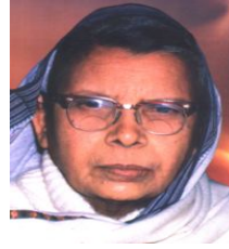
महादेवी वर्मा 26 मार्च, 1907