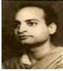
रांगेय राघव 17 जनवरी, 1923

आर ओ एच डिपो, अधिकारी क्लब "ताप्ती", बीटीसी (स. तथा मा.) लोको शेड, तथा एटीटीएस भुसावल में हिंदी साहित्य के निम्नलिखित साहित्यकारों के नाम पर हिंदी पुस्तकालय एवं वाचनालय खोले गए हैं। हिंदी पुस्तकालयों को अधिक से अधिक उपयोगी बनाने की दृष्टि से मंडल के राजभाषा विभाग द्वारा इन महान साहित्यकारों की जयंतियां मनाई गई तथा उनकी रचनाओं से रेलकर्मियों को अवगत कराने के साथ-साथ उन्हें पढ़ने के लिए प्रेरित किया गया।