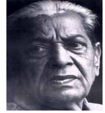
भवानी प्रसाद मिश्र 29 मार्च, 1913

हिंदी साहित्य के इन महान संपूर्णों की जयंती पर राजभाषा विभाग श्रद्धा सुमन अर्पित करता है।