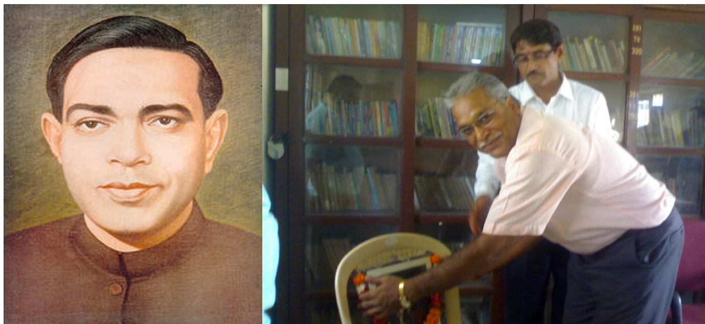
रामधारी सिंह 'दिनकर' जन्म-तिथि: 23.09.1908