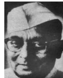
भगवती चरण वर्मा जन्म: 30.08.1903