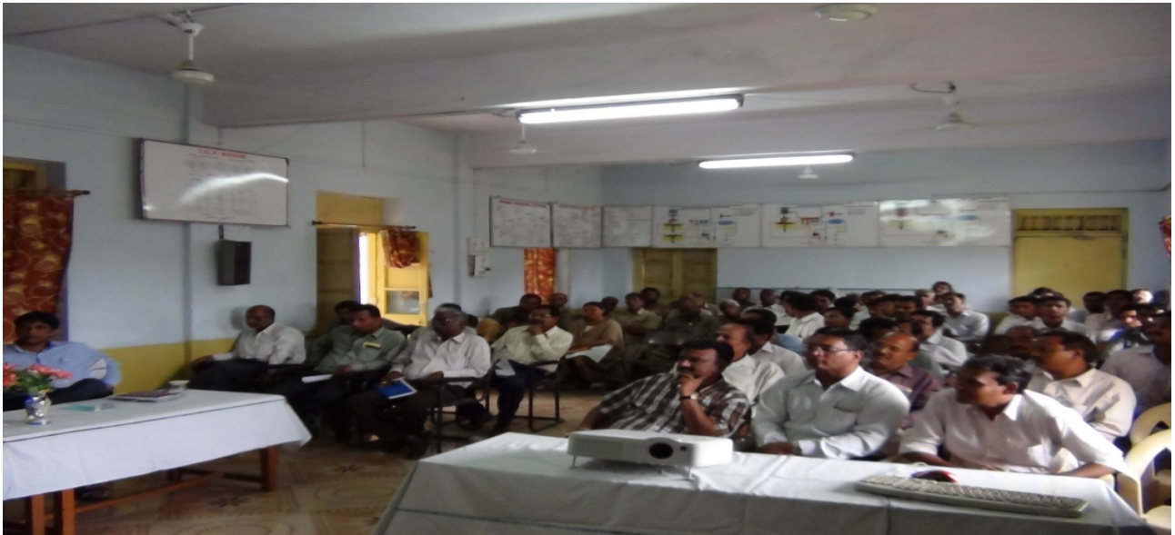
तकनीकी संगोष्ठी की एक झलक

31 मार्च, 2013 को समाप्त तिमाही के दौरान मंडल कार्यालय के यांत्रिक शाखा के तत्वावधान में बुनियादी प्रशिक्षण केंद्र (सवारी तथा मालडिब्बा), भुसावल में "कोच तथा वैगन में ब्रेक बाइंडिंग के कारण तथा दोष निवारण, आरओएच के दौरान चेक किए जाने वाले महत्वपूर्ण आयाम, नॉन स्टॉप इंडेंट, डिफाइड ब्रेक सिस्टम, सेफ टू रन परीक्षण तथा पैसेंजर शिकायतों का निवारण, डिरेलमेंट की विस्तृत जानकारी, आपदा प्रबंधन, एल.एच.बी. तथा हाई स्पीड कोच की विस्तृत जानकारी, सवारी तथा मालडिब्बा में उपयोग होने वाले एमएण्डपी की जानकारी, एक्सल पर अल्ट्रासोनिक टेस्टिंग, हवील डिफेक्ट, वर्ष 2012-13 में सभी डेपो के उपलब्धियों के विषय में चर्चा तथा एआरटी की कार्य प्रणाली" विषयों पर तकनीकी संगोष्ठियों का आयोजन किया गया जिसमें सभी वक्ताओं द्वारा अपने आलेख हिंदी में प्रस्तुत किए गए। उक्त संगोष्ठियों में कुल 619 कर्मचारियों ने भाग लिया।