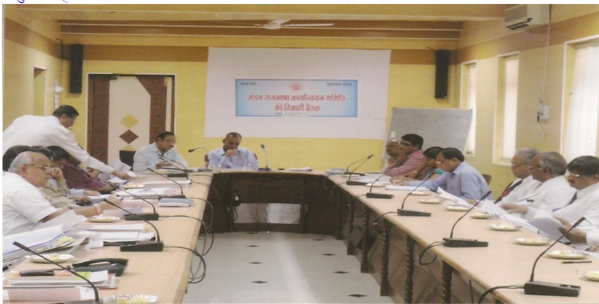
मंडल समिति की बैठक एक झलक